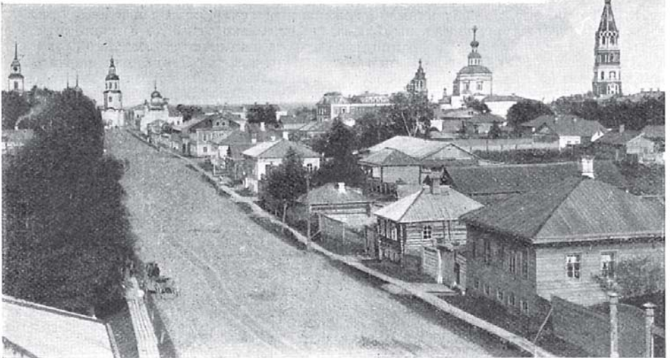
Вятская улица и юго-восточная часть г. Слободского..

Въ настоящее время Слободской по своему внѣшнему виду и благоустройству является однимъ изъ лучшихъ городовъ Вятской губ. По переписи 1897 г. въ немъ числилось 10.050 жит.; зданій въ городѣ 1.150, изъ нихъ до 200 каменныхъ. Церквей, 9; изъ нихъ замѣчательны Екатерининскій соборъ построенный въ 1695 г., и соборъ Преображенскій — въ 1699 г., а отдѣльная при немъ церковь — въ 1784 г. Въ Срѣтен-