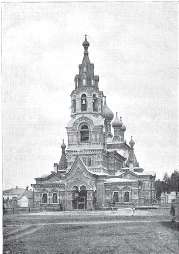
Никольская церковь въ г. Слободскомъ. (По фот. В. М. Рѣтина).