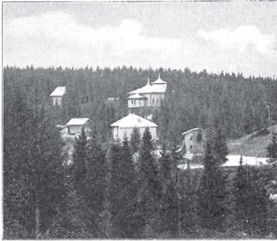
Филейскій монастырь близъ г. Вятки.

Въ 12 вер. къ с. отъ Вятки, по правую сторону рѣки находится с. Бобино ( Никольское ), въ которомъ насчитывается болѣе 100 жителей, есть церковь, школа, волостное правленіе и сельское попечительство дѣтскихъ пріютовъ. Жители занимаются производствомъ корешковыхъ корзинъ. Въ Бобинской вол., при мельницѣ Сидинихъ находится кожевенный заводъ Долгушина (сущ. съ 1839 г.), съ производствомъ на сумму