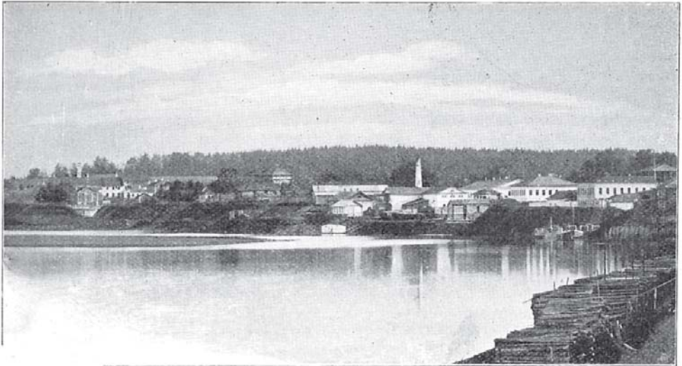
Фабричный посело́къ Демьянка близъ г. Слободскаго.