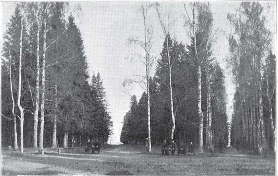
Загородный садъ въ окрестностяхъ г. Вятки.

вслѣдствіе ли душевной усталости, или просто отъ дорожнаго утомленія, и острогъ, и присутственныя мѣста кажутся вамъ „пріютами мира и любви“, лачужки населяются Филемонами и Бавкидами, и вы ощущаете въ душѣ вашей такую ясность, такую кротость и мягкость... Но вотъ долетаютъ до васъ звуки колоколовъ, зовущихъ ко всенощной, вы еще далеко отъ города, и звуки касаются слуха вашего безразлично, въ видѣ общаго гула, какъ будто весь воздухъ полонъ чудной музыки, какъ будто все вокругъ васъ живетъ и дышетъ, и если вы когда-нибудь были ребенкомъ, если у васъ было дѣтство, оно съ изумительной подробностью встанетъ предъ вами, и внезапно воскреснетъ въ вашемъ сердцѣ