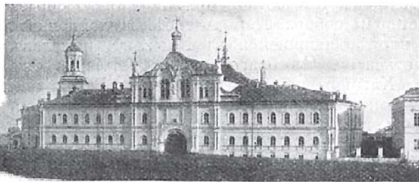
Женскій монастырь въ Вяткѣ.

территоріи раскинулись зданія губернской земской больницы и дома для умалишенныхъ съ сельско-хозяйственной фермой, а за нею въ 1½ вер. отъ города самое древнее учебное заведеніе Вятскаго края — духовная семинарія, основанная въ 1734 году. Противъ земской больницы къ