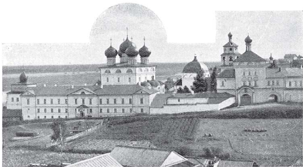
Трифоновъ монастырь въ г. Вяткѣ.

ской Успенскій Трифоновъ монастырь 2-го класса. Монастырь основанъ въ концѣ XVI в. преп. Трифономъ. Трифонъ не былъ уроженцемъ Вятскаго края. На 22-мъ году, принявъ схиму въ Пыскорскомъ монастырѣ, онъ долгое время жилъ въ Пермскомъ краѣ. Узнавъ, что на Вяткѣ нѣтъ иноческаго житія, Трифонъ оставилъ Пермь и черезъ Чердынъ, Кай и Слободской пришелъ въ Хлыновъ, съ намѣреніемъ основать здѣсь обитель. Жители Хлынова вначалѣ не совсѣмъ ласково приняли его. Но вскорѣ искренняя набожность и его смиреніе внушили къ нему общее уваженіе. Въ 1580 г., бывши въ Москвѣ, преп. Трифонъ, по желанію хлыновцевъ, исходатайствовалъ у царя позволеніе основать обитель въ Хлыновѣ. Первой церковью въ основанномъ Трифономъ монастырѣ была церковь во имя Благовѣщенія.