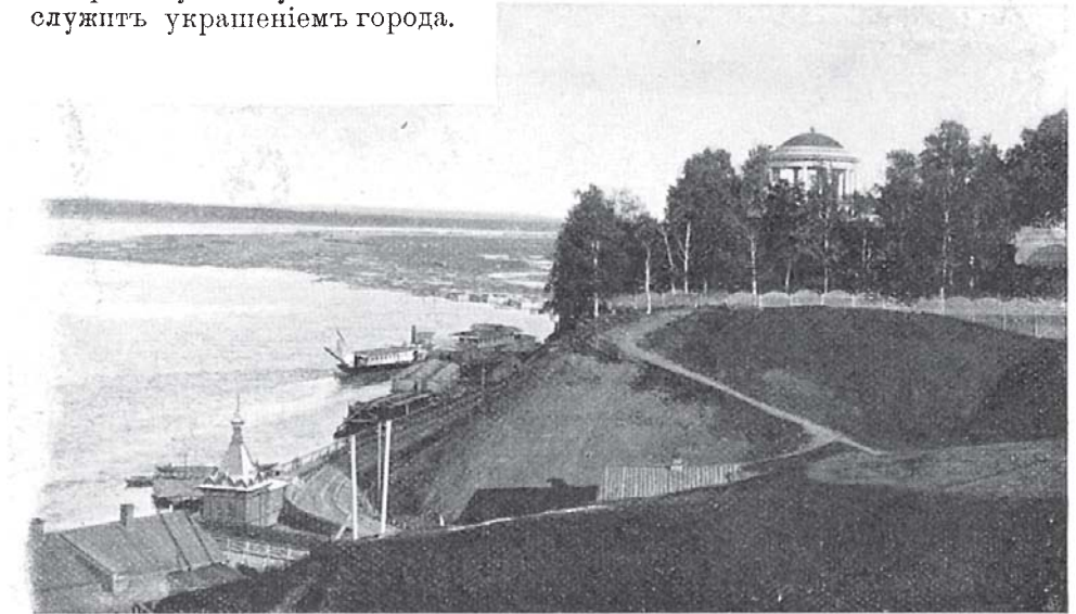
Прирѣчная часть г. Вятки. (По фот. С. А. Лобовикова).

сенское и Богоявленское села были до основанія разрушены туземцами, и потому намѣченныя церкви были построены въ самомъ Хлыновѣ. Такъ возникла Богоявленская церковь. Въ 1698 г. церковь выстроили каменную; въ этомъ видѣ она существуетъ и донинѣ. Катедральный Троицкій соборъ первоначально былъ Никольской церковью, построенной въ концѣ XIV или въ первыхъ годахъ XV в. по случаю перенесенія въ Хлыновъ чудотворной иконы св. Николая съ Великой рѣки. При открытіи Вятской епархіи въ 1658 г. Никольская церковь была сдѣлана катедральнымъ соборомъ. Въ 1677 г., при архіепископѣ Іонѣ заложено было каменное зданіе собора, оконченное постройкой въ 1683 г., а въ 1770 г. заложень былъ новый соборъ, тотъ самый, который существуетъ нынѣ и служить украшеніемъ города.