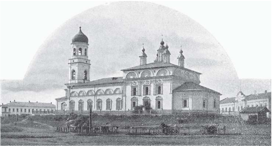
Воскресенскій соборъ въ гор. Вяткѣ.

За каедральнымъ соборомъ раскинулась Соборная площадь, на другомъ концѣ которой расположенъ Спасскій соборъ. Онъ построенъ