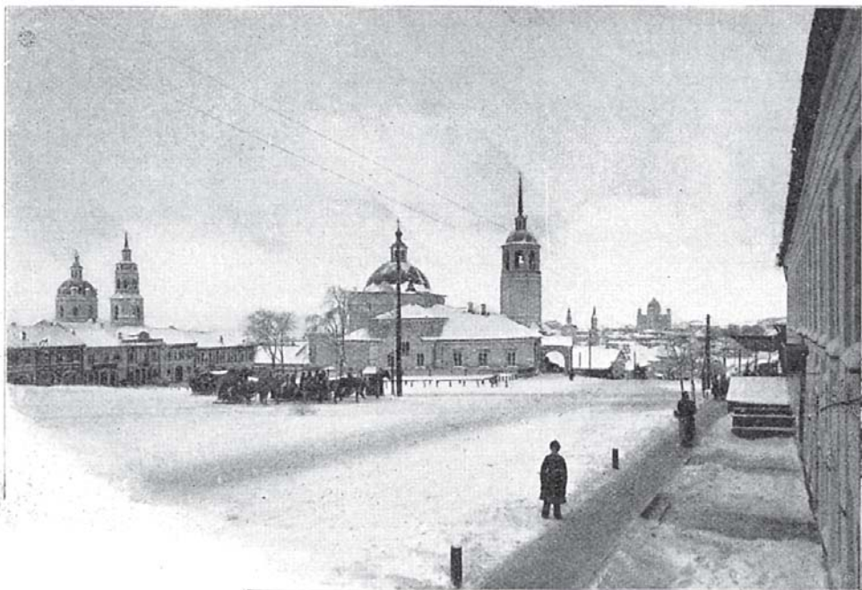
Соборная площадь въ г. Вяткѣ.

стратига Михаила и Тихвинской Божіей Матери. Явленіе иконы св. Николая относится нѣкоторыми къ 1383 г.; икона явилась, по преданію, на берегу р. Великой въ чащѣ лѣса, близъ нынѣшняго с. Великорѣцкаго Орловскаго у., изъ котораго вскорѣ послѣ явленія она была перенесена въ Хлыновъ, гдѣ и построена была Никольская церковь. Слухъ о бывающихъ передъ иконою чудесахъ распространился не только по всей Вятской землѣ и въ сосѣднихъ съ нею областяхъ, но дошелъ и до Москвы. Покоритель Казанскаго царства, царь Иванъ Грозный пожелалъ видѣть и помолиться передъ иконою Великорѣцкаго Николая, и она была приносима въ Москву въ 1557 г. Пребы