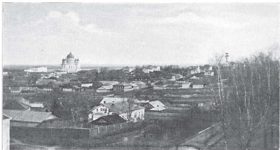
2-я часть г. Вятки. (По фот. П. Г. Тихонова).

винѣ XIX в., съ открытіемъ пароходства по Волгѣ и ея притокамъ, развились торговыя сношенія Вятки съ Н.-Новгородомъ, Казанью и Москвой, и товары изъ Вятскаго края направились внизъ по Волгѣ и Камѣ къ этимъ городамъ. Въ послѣднее время, благодаря проведенію желѣзной дороги на Котласъ, временно ослабѣвшія связи Вятки съ сѣвернымъ краемъ возобновились. Въ началѣ XX в. торговыхъ предприятий въ городѣ было 470, съ общимъ оборотомъ въ 6.125 тыс. руб. и промышленныхъ 57, съ оборотомъ въ 1.996 тыс. руб. Городъ считается однимъ изъ видныхъ пунктовъ кожевенной промышленности, значительное мѣсто занимаетъ въ ряду другихъ городовъ и по хлѣб-