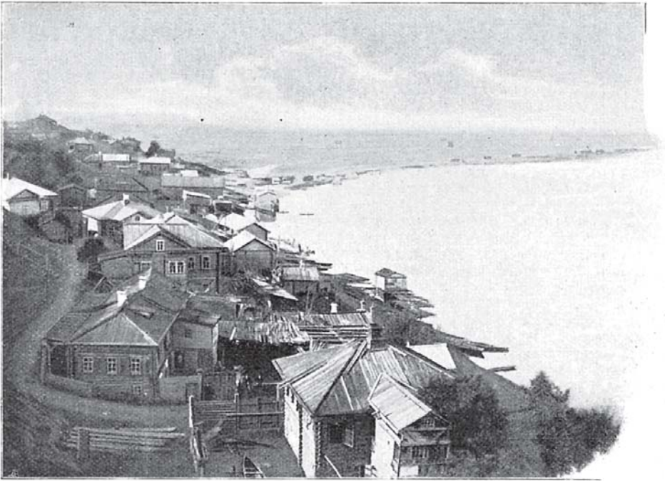
Набережная г. Слободского и заливные луга.

земляными валами. Вступивъ черезъ Чепцу на р. Вятку, новгородцы увидѣли въ 5 вер. отъ устья чудской городокъ, стоявшій на высокой горѣ и хорошо укрѣпленный. Чудь называла будто бы принадлежащій ей городъ Болвановскимъ 1) . Городъ этотъ понравился новгородцамъ и они рѣшили взять его ратью. Не надѣясь на свои силы, они прибѣгли къ небесной помощи. Съ этой цѣлью вся дружина дала зарокъ не пить и не ѣсть до тѣхъ поръ, пока не возьмутъ городъ. Во все это время, готовясь къ бою, они молились угодникамъ Божиимъ Борису и Глѣбу, чтобы они помогли имъ въ битвѣ такъ же, какъ нѣкогда помогли Александру Невскому въ его побѣдѣ надъ супротивными шведами. Начался приступъ для взятія города, и угодники помогли имъ одолѣть врага. Множество чуди и отяковъ было побито, а часть