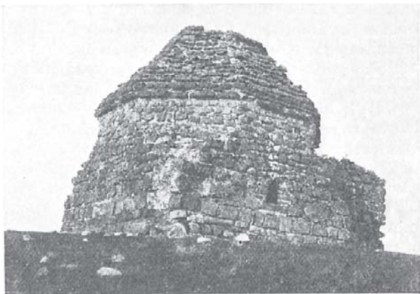
Могила Барача-Хана (XIV в.).

Еще прежде чѣмъ Пугачевъ приступилъ къ Оренбургу, въ южной части Пермской губ. (Осинскій и Кунгурскій у.у.) возстали осинскіе татары. Слухи объ осадѣ Оренбурга и о намѣреніи сибирскихъ инородцевъ соединиться съ пермскими татарами придавали послѣднимъ въ глазахъ мѣстнаго населенія грозную силу. Ближайшей цѣлью татаръ былъ казенный заводъ Еюшихинскій (около нынѣшней Перми). Дѣло однако ограничилось разграбленіемъ нѣсколькихъ селеній, и только на слѣдующій годъ, когда сюда явился самъ Емельянь, была взята и разграблена Оса. Въ то-же время 15-тысячное войско самозванца подъ предводительствомъ Чики втеченіе четырехъ мѣсяцевъ осаждало Уфу. Одновременно шайка пугачевскихъ застрѣльщиковъ, переправившись черезъ Каму, начала свое разрушительное дѣло въ Вятской губ. — въ предѣлахъ нынѣшняго Елабужскаго у. Сосѣдніе съ Елабугой селенія (с. Трехсвятское ) сразу пристали къ пугачевцамъ и