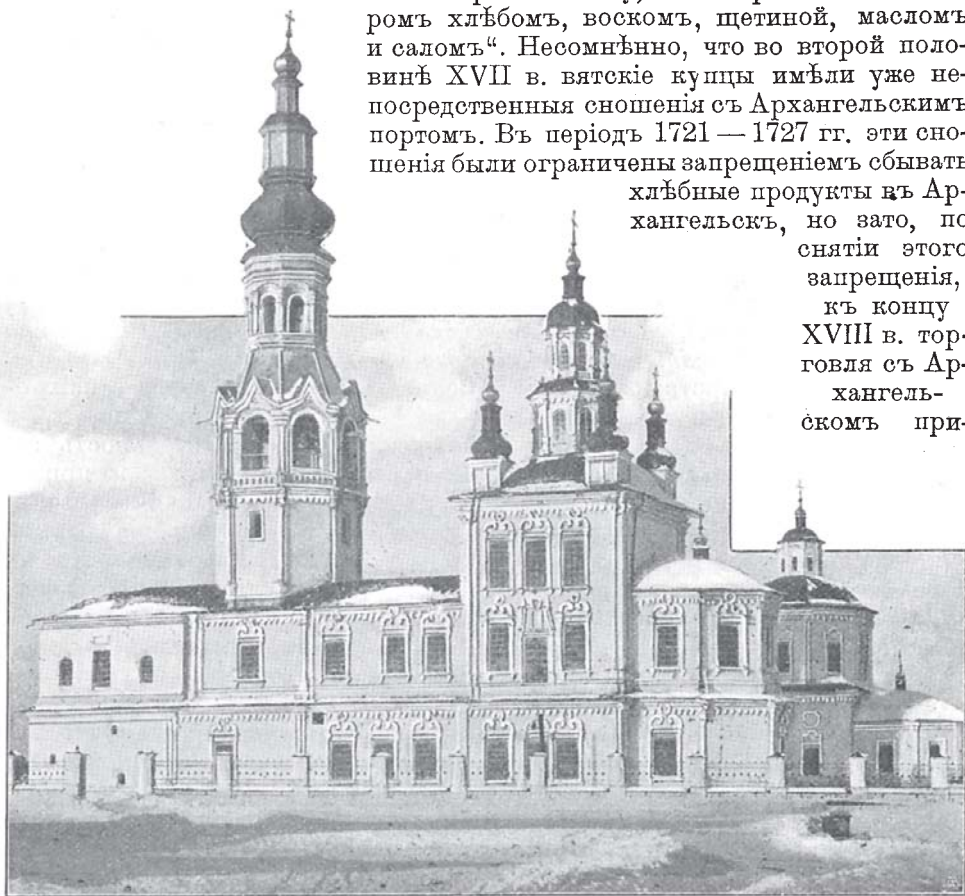
Старинная церковь въ гор. Верхотурьѣ. 1

хлѣбные продукты въ Архангельскъ, но зато, по снятіи этого запрещенія, къ концу XVIII в. торговля съ Архангельскомъ при-