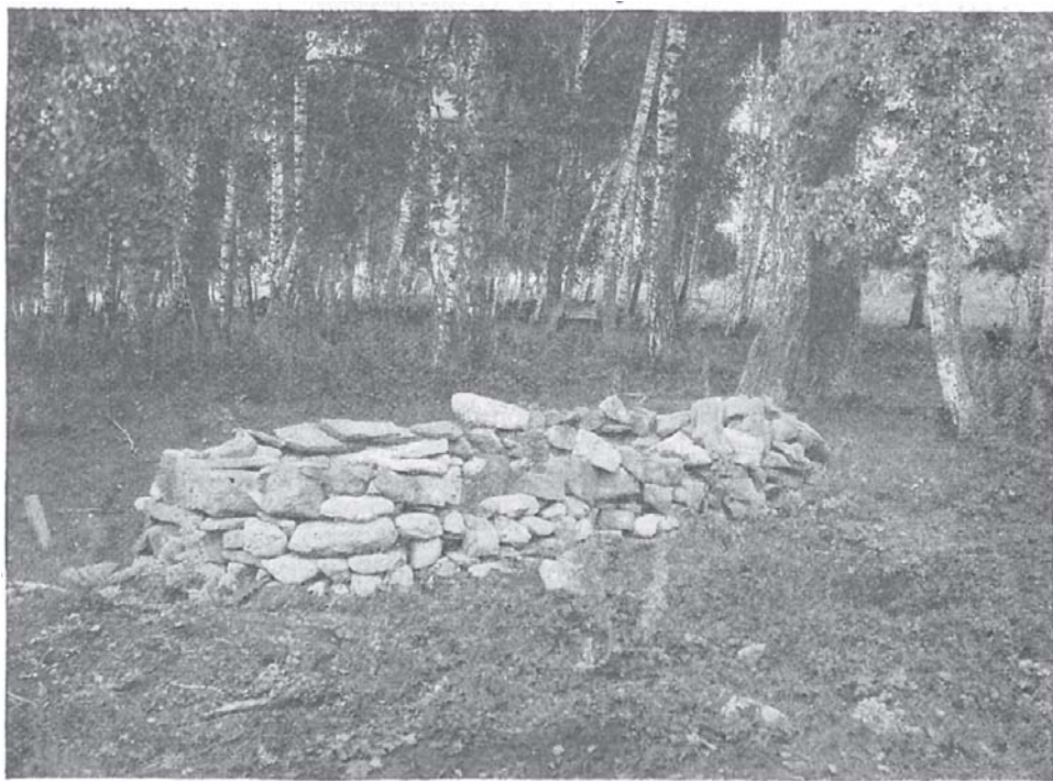
Надгробный памятникъ на башкирскомъ кладбищѣ.

шло наружное укрѣпленіе—острогъ; наконецъ ровъ, пролежавшій снаружи всей постройки, довершалъ систему укрѣпленій. Во вновь основываемые городки, изъ которыхъ первымъ былъ Кай , население стекалось отовсюду, давая впечатлѣніе причудливой смѣси „одеждъ и лицъ, племенъ, нарѣчій, состояній“. Тутъ были устюжане, вятчане, верхокамцы, южане (отъ р. Юга), двиняне, вычегжане, москвичи, владимірцы, а изъ инородцевъ—вогулы, югра, мордва, зыряне, татары и др. Сюда же направлялись бѣглецы изъ разныхъ воинскихъ частей солдаты, а позднѣе—крѣпостные крестьяне. Наряду съ добровольно пришлымъ и бѣглымъ населеніемъ вселялись огромныя партіи крестьянъ по распоряженію